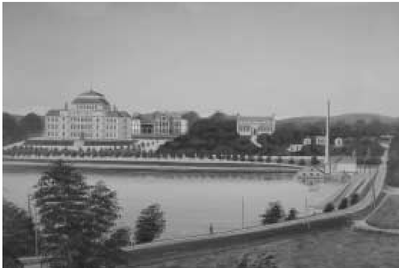
1. Växjö läroverk (t.v.) och Smålands museum (i mitten), färdigställda 1889 respektive 1885. Läroverket revs på 1960-talet för att ge plats för lasarettets utbyggnad. Smålands museum har byggts till i olika omgångar, senast 1996. Oljemålning från 1900-talets början. Okänd konstnär. Smålands museums samlingar.

Den 6 juni 1798 mottog ”Wexiö Kongl. Gymnasii Myntkabinett” en